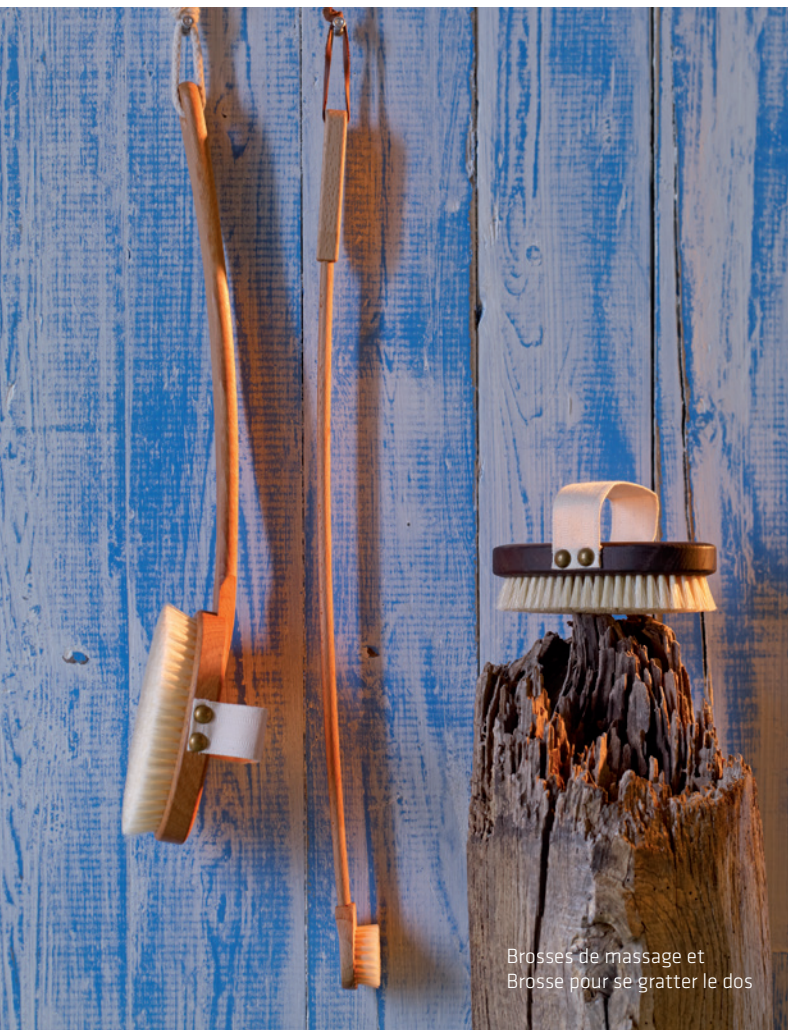
Brosses de massage et Brosse pour se gratter le dos